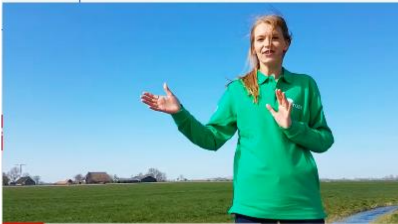
Pitch Buurtmolen Tzum